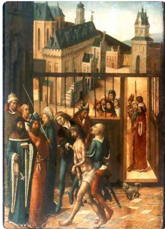
Christus voor Pilatus

Een onbekende Haarlemse kunstenaar, veelal de Meester van Bellaert genoemd, schilderde in de jaren 1483-1486, een paneel, een schilderij op eikenhout, voorstellende Christus voor Pilatus. Op de voorgrond wordt de gemartelde Jezus door twee beulsknechten voorgeleid. Pilatus, die een met hermelijn afgezette mantel draagt zoals een Europees vorst uit die tijd zou hebben gedaan, houdt het briefje in zijn hand waarin zijn vrouw hem waarschuwt Jezus niet te veroordelen. Van achter een hek wordt dit gadegeslagen door enige toeschouwers. Op de achtergrond is een stadsgezicht te zien, waarin het Haarlemse stadhuis te herkennen valt. Daarachter staat een tweebeukige kerk, de kloosterkerk van de Dominicanen, die daar vanaf 1296 hun klooster hadden. Hun refter en kloostergang maken nog deel uit van het stadhuiscomplex en het poortje in de Zijlstraat naar het Pand en het Prinsenhof is een oude ingang tot dat klooster.