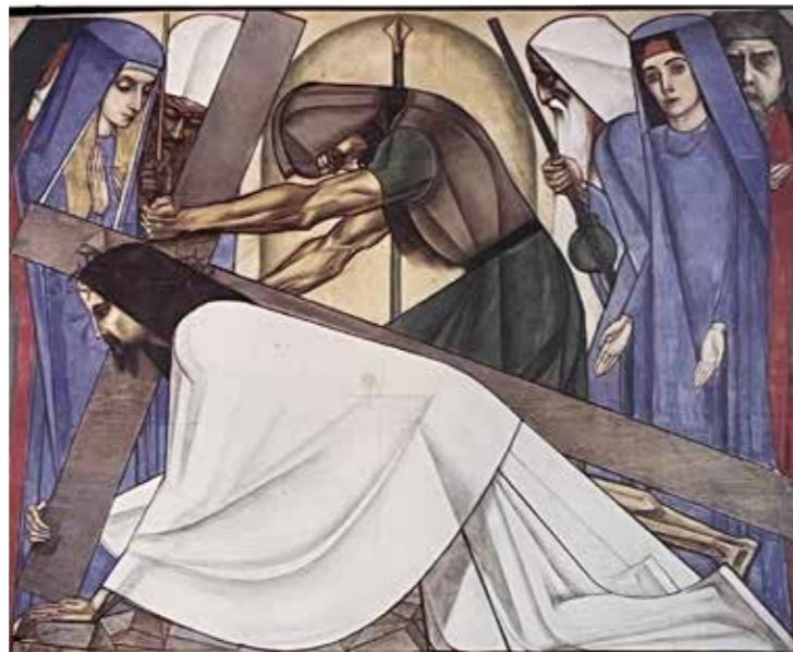
Rechts in de hoek het gezicht van Jan Toorop