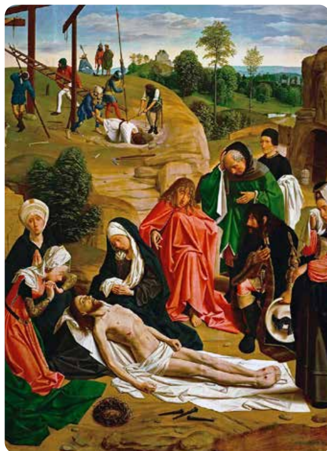
De bewening van Christus

In de late middeleeuwen was het niet ongebruikelijk Bijbelse gebeurtenissen in de eigen omgeving te plaatsen. Als Maria en Joseph in Bethlehem een herberg zoeken, gebeurt dat op een schilderij van Pieter Breugel uit 1566 in een winters Brabants dorp. Door Bijbelse verhalen in de eigen omgeving te plaatsen werden ze begrijpelijk voor de toeschouwer. Geertgen (kleine Geert) tot St Jans was een lekenbroeder uit het St. Jansklooster, het klooster waarnaar de Jansstraat is vernoemd en waarvan de kerk nu dienst doet als Noord-Hollands Archief. Hij wordt beschouwd als één van de belangrijkste schilders van zijn tijd.