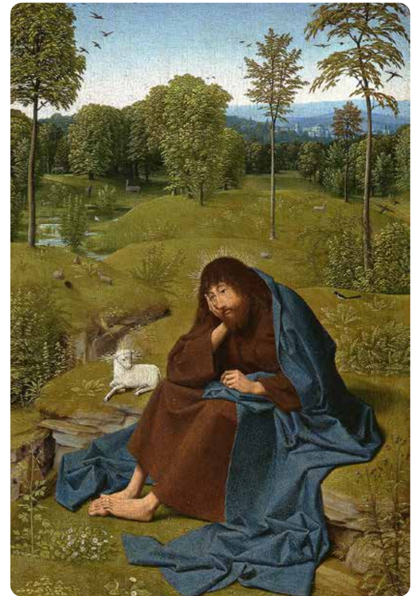
Johannes de Doper in de woestijn

Dat het verbeelden van het Passieverhaal niet tot de schilderkunst beperkt bleef, blijkt uit het eerste in Haarlem geschreven toneelstuk waarvan de titel is overgeleverd: Ecce Homo. Op St. Albrechtsdag, 24 november, de feestdag van de heilige Adelbert van Luik, werd in Haarlem in de late middeleeuwen steeds een processie gehouden, waarschijnlijk omdat dit de naamdag was van de belangrijke Hollandse graaf Albrecht van Beieren (1336-1404). In 1534 werd tijdens de processie een passiespel opgevoerd. Dit 'spel van Ecce Homo', het spel getiteld Ecce Homo, was een oorspronkelijk Haarlems toneelstuk over 'een deel van der passie ons Heren, twelck den gemeenen volcke zeer bequam gedocht heeft, overmits die vermaninge tot devoicien die dair inne gelegen was.' De tekst zelf is niet overgeleverd, maar de stadsbestuurders waren zo enthousiast dat de burgemeesters de toneelspelers drie tonnen bier gaven. Uiteraard moest dat in de boekhouding worden verantwoord en uit die boekhouding is het stuk bekend. Dat het stuk opriep tot devotie en vermaande tot vroomheid werd gewaardeerd, maar toen de spelers een jaar later een klucht opvoerden, nu na en niet tijdens de processie, waren de toeschouwers ook enthousiast. In de boekhouding stond nu dat